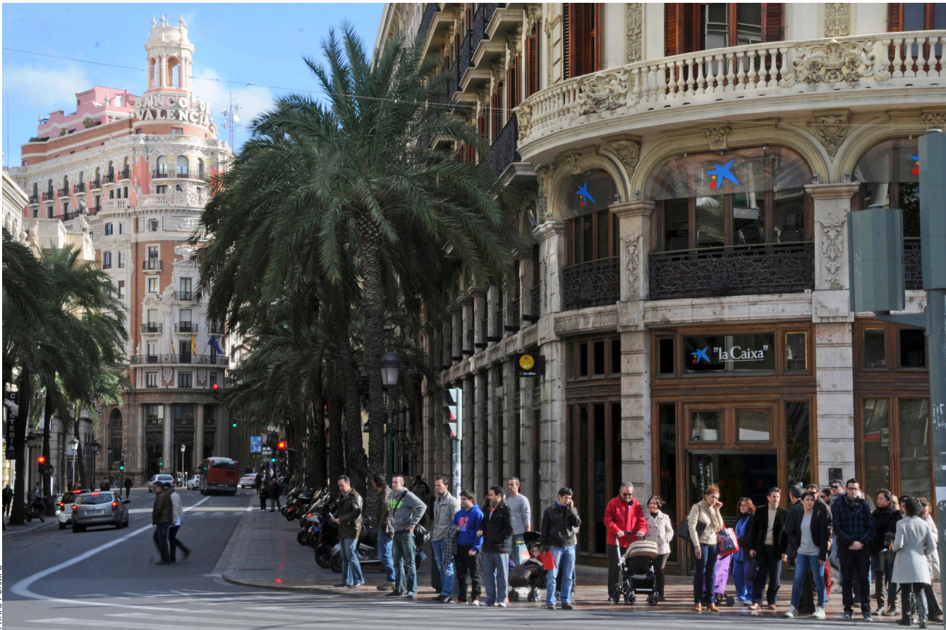
PRATS I CAMPS